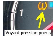
Voyant pression pneus

33-Montrez la commande de réglage de hauteur des feux.